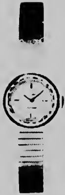
LADYMATIC- automatico cu banchi di oro. Den modelnan mascha chic. Den 18 karaat di oro. Prijs for di F. 520.--